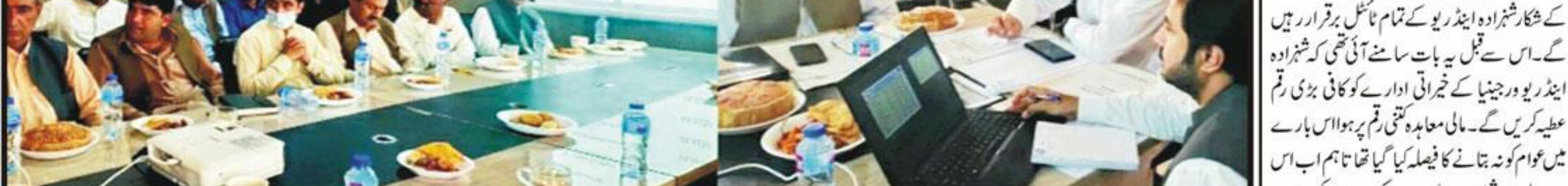
صحبت پورے ڈیپٹی مشنر علیہم جان مزدوری ایس ایم شجاعین میٹنگ میں بی بی ایچ کی اہانہ کارکن کی رپورٹ کے متعلق آگاہی فراہم کر رہے ہیں

مغربی کنارہ (این این آئی) رام اللہ کے شمال مغرب میں واقع گاؤں میں اسرائیلی فوج کے تشدد سے متعدد فلسطینی زخمی مغربی کنارہ (این این آئی) رام اللہ کے شمال مغرب میں واقع گاؤں میں اسرائیلی فوج کے تشدد سے متعدد فلسطینی زخمی غریب اردوں میں اسرائیلی فوج کے تشدد سے متعدد فلسطینی زخمی مغربی کنارہ (این این آئی) رام اللہ کے شمال مغرب میں واقع گاؤں میں اسرائیلی فوج کے تشدد سے متعدد فلسطینی زخمی