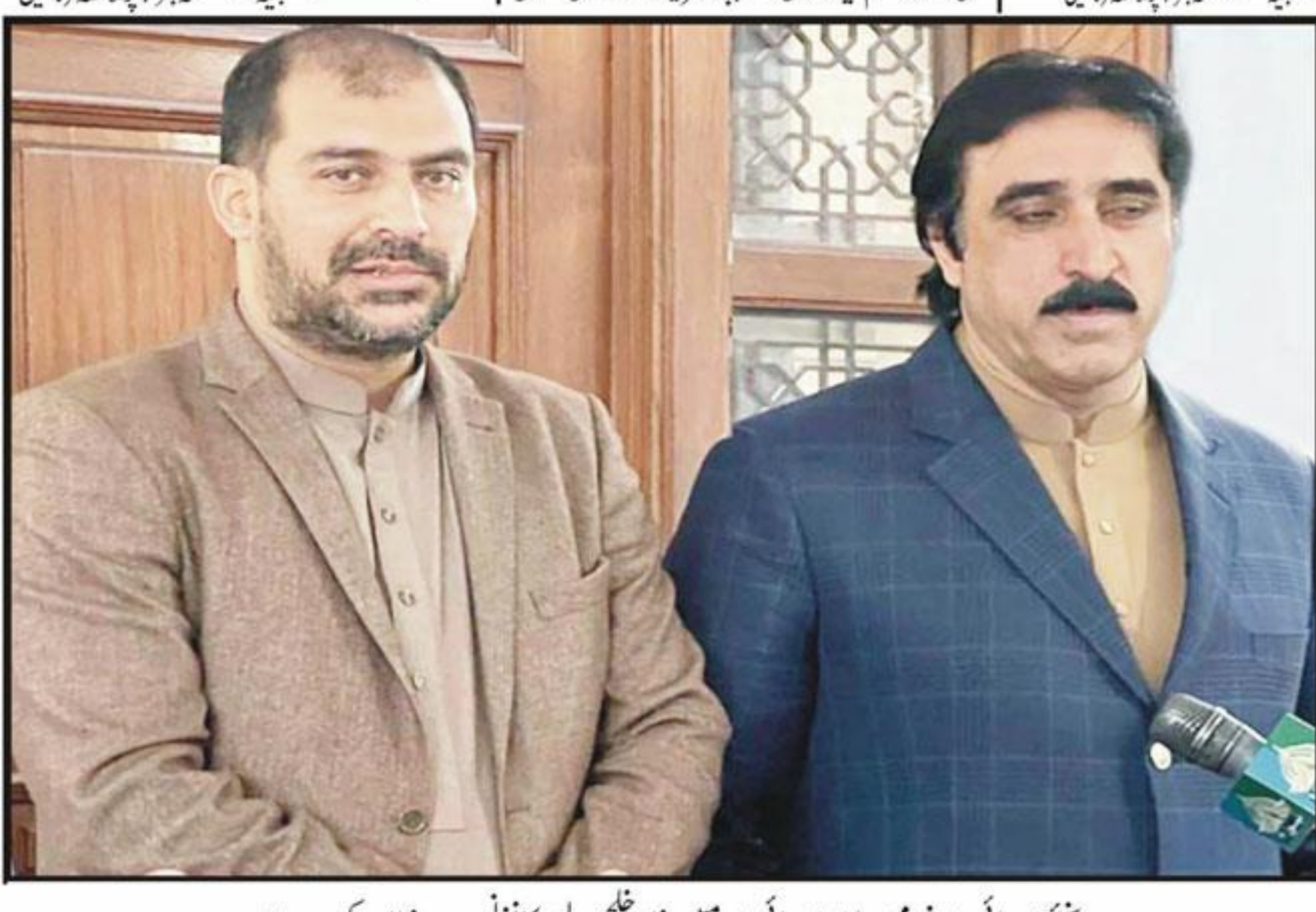
سنیئر صوبائی وزیر پرویز خٹک اور صوبائی وزیر زمین خان علی پریس کانفرنس سے خطاب کر رہے ہیں

اسلام آباد (این این آئی) پاکستان مسلم لیگ (ق) کے سربراہان نے واشنگٹن میں امریکا کے ساتھ امن معاہدے پر شدید احتجاج شروع کر دیا۔