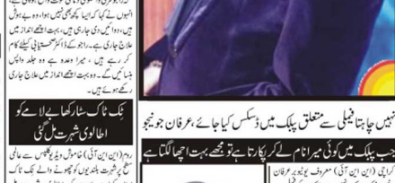
بلک سٹار کھالے لے کر۔

بلک سٹار کھالے لے کر۔ بلک سٹار کھالے لے کر۔ بلک سٹار کھالے لے کر۔