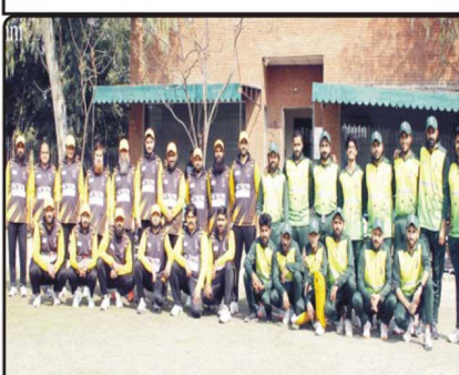
ایٹلیا سٹیپس میں بھارت کے کرکٹرز کی ٹیم کی تصویر۔