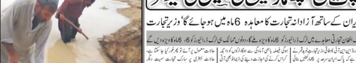
سیلاب متاثرین کیلئے 37 ارب روپے مختص کرے ہیں شہری۔