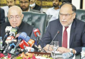
سیلاب متاثرین کیلئے 23 افراد جان بحق ہوئے۔

جھڑ پانی میں 9 افراد، گھٹا پانی میں 5 افراد، اوستہ محمد میں 6 افراد اور بارکھان میں 3 افراد جان بحق ہوئے۔