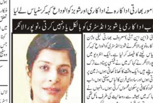
اب اداکاری شوہر کی اعزیزیت کرتی، نو پورا لاکھ۔

اب اداکاری شوہر کی اعزیزیت کرتی، نو پورا لاکھ۔ اب اداکاری شوہر کی اعزیزیت کرتی، نو پورا لاکھ۔ اب اداکاری شوہر کی اعزیزیت کرتی، نو پورا لاکھ۔