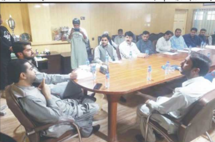
کوئٹہ اور دیگر شہروں میں شہداء اور شہداء کے لواحقین کے ساتھ ملاقات کے دوران ان کے بارے میں گفتگو اور ان کے مسائل کو حل کرنے کے لیے کوشش کی جا رہی ہے۔

سلمان رشدی سے زیادہ غلیظ انسان کوئی نہیں، سائیکوٹری میں لنگن شہری کے قتل کے واقعہ کا حوالہ دیتا تھا کہ کسی کو اجازت نہیں ہوتی جائے قانون ہاتھ میں لے کر کسی کو بھی قتل کرے، پاکستان کے جہروں کو بیت پناہی کرنے والے شخص کے ہیں، انتخابات میں جیتتی تاخیر ہوگی ہماری پارٹی کو اتنا فائدہ ہوگا، یہ ابھی تک جاہن تو تھے ماہل نہیں کرنا سکتے سابق وزیر اعظم