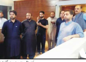
کونسلر اور دیگر اہل ذمہ داران کی ایک گروہ کی سربراہی میں ڈی ایچ ڈی اور دیگر گروہ پر بحث کے بعد ہیں

ریلوے کی ایک اور سٹیڈیو پرنسٹن کے خطے کے ایک اور ایس جی