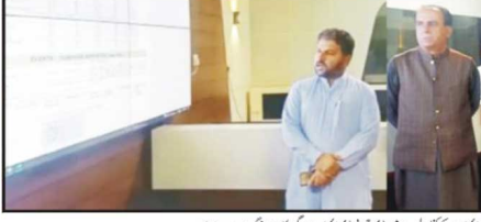
کونسلر اور دیگر اہل ذمہ داران کی ایک گروہ کی سربراہی میں ڈی ایچ ڈی اور دیگر گروہ پر بحث کے بعد ہیں

کھجی کینال فیڈر کینال میں پڑنے والے ڈھلوانے تین یو این کو سول کو طور پر تیار کروایا